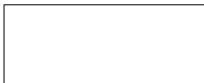
Tabela cenowa elementów robót wykonania zamówienia pn.: