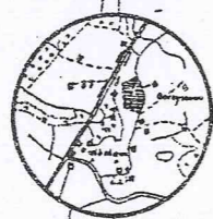
ORIENTACJA 1:25 000

Gdańsk dn. 04.09.2001 Nr ks. rob. 2409/18/2001 KERG 1352/2001